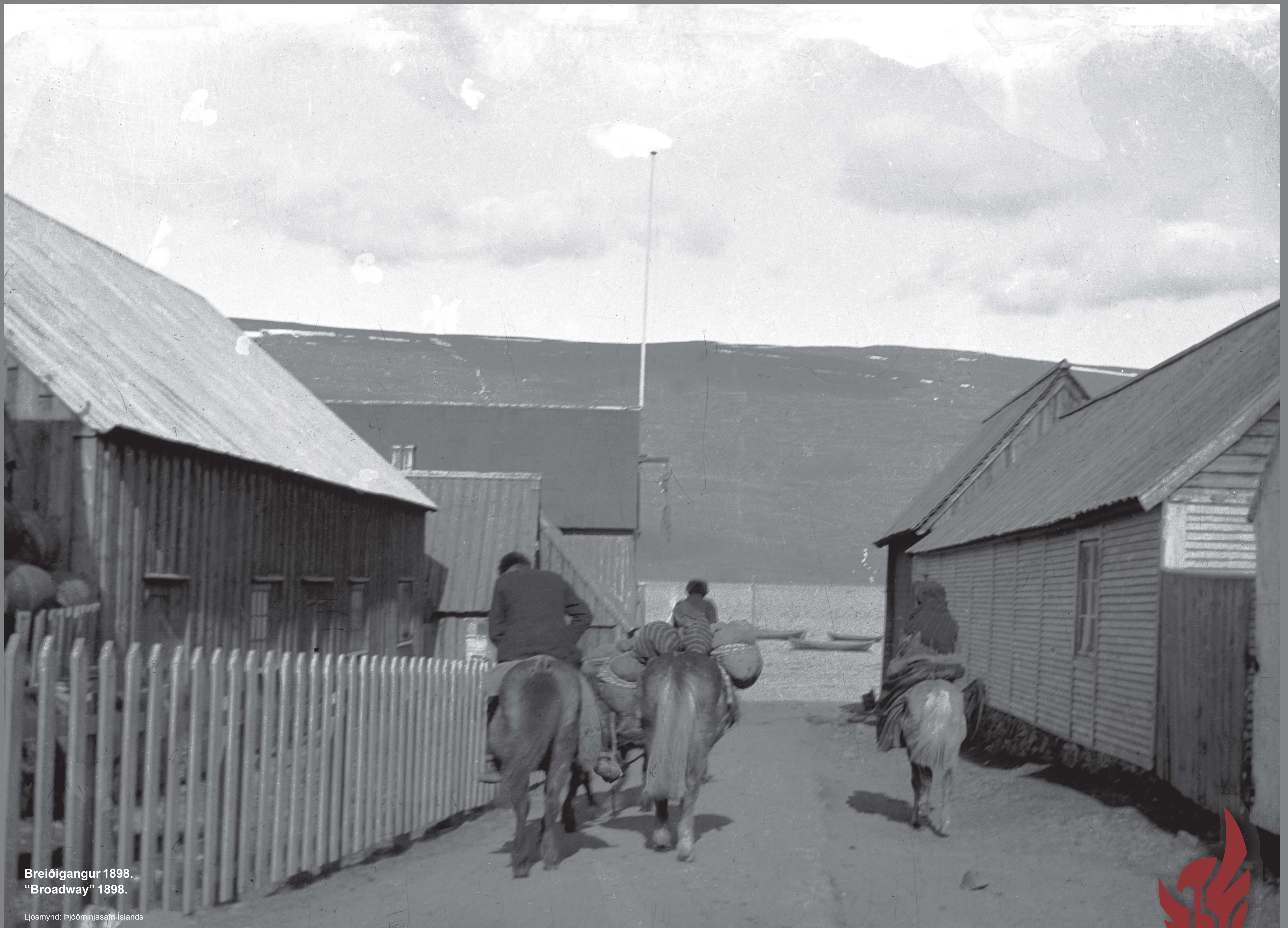
Breiðgangur 1898. "Broadway" 1898.