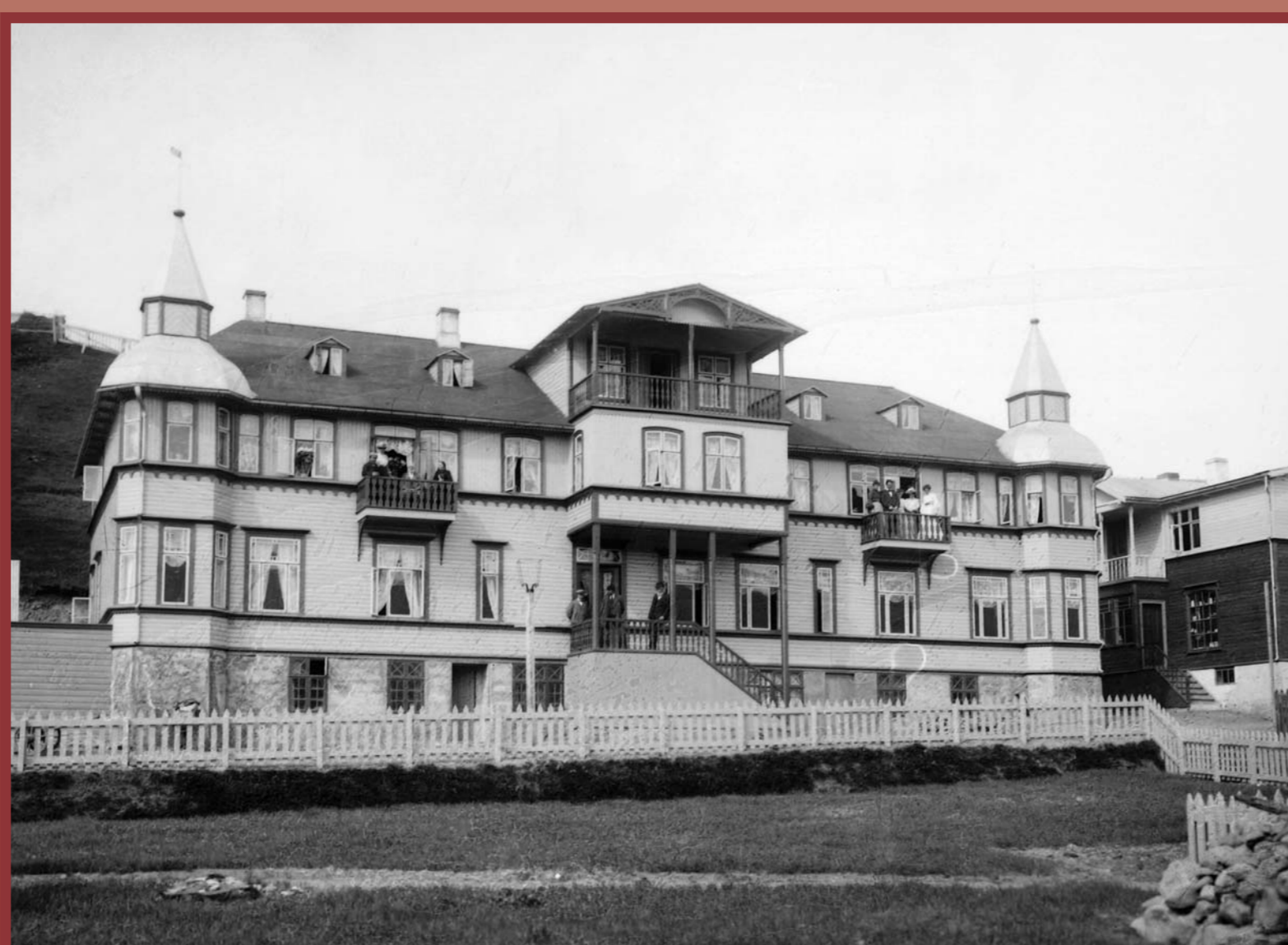
Hótel Akureyri var eitt glæsilegasta hótél landsins, tekið í notkun árið 1902. Það brann í nóvember 1955, þá orðið fjölþýlishús fyrir efnaminni bæjarbúa. Hótel Akureyri, opened in 1902, was then one of Iceland's most elegant hotels. When the building burned down in November 1955, it had become an apartment building for low-income families.