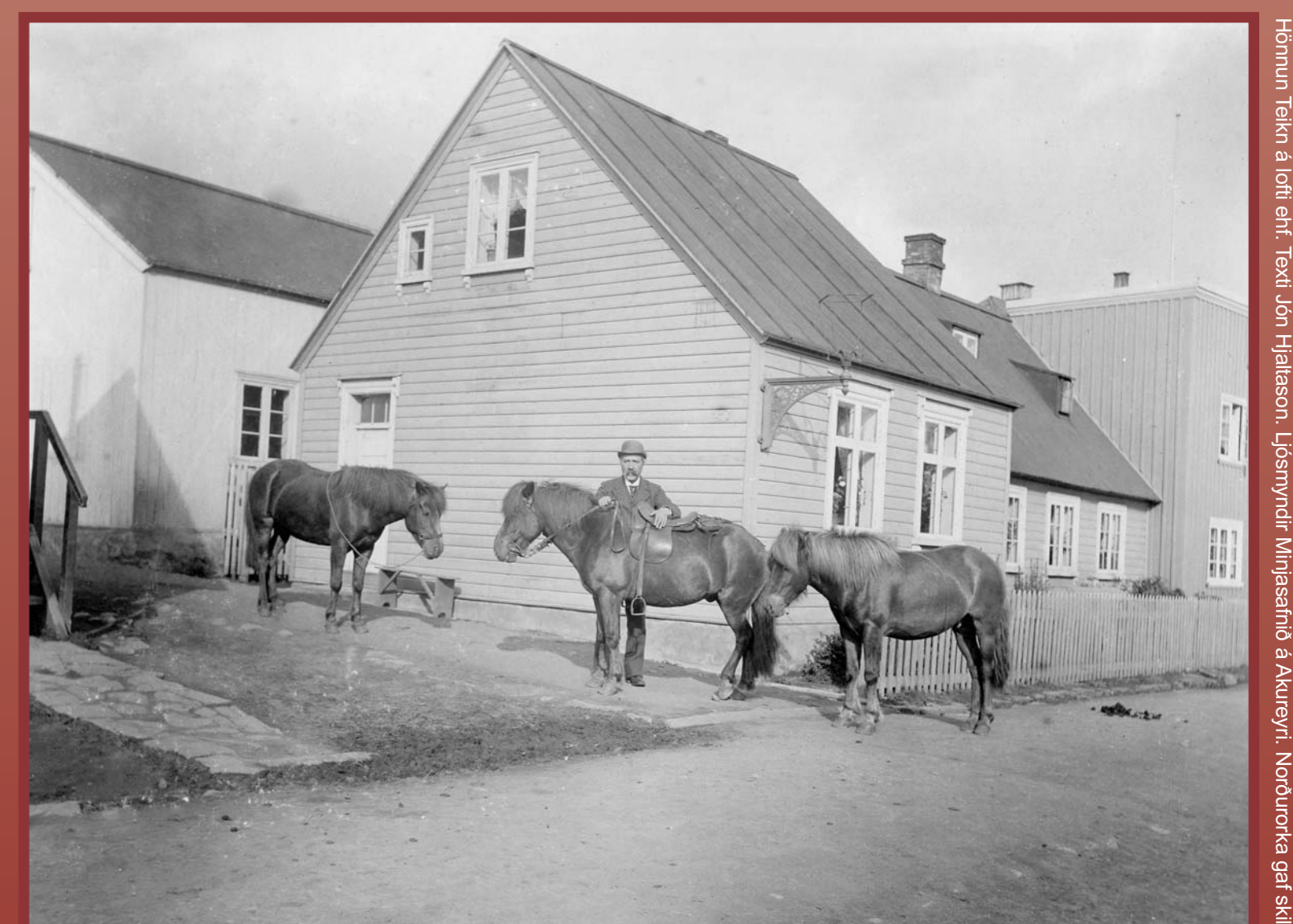
Þessi sambyggðu hús á horni Lækjargötu og Aðalstrætis er elsta húsabyrping bæjarins, byggð 1840 - 1870 en myndin er tekin um 1895. The conjoined houses on the corner of Lækjargata and Aðalstræti constitute the oldest building cluster in Akureyri, constructed 1840 - 1870. The picture dates from around 1895.