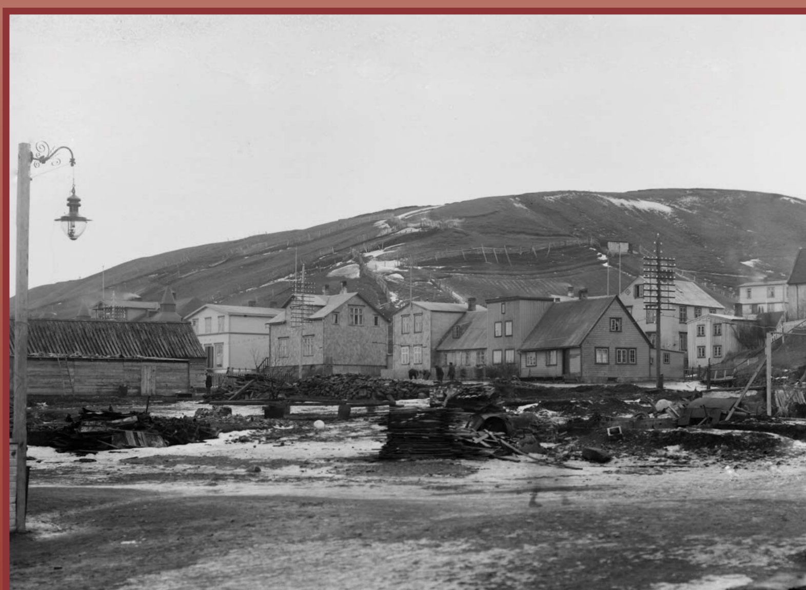
Árið 1912 brunnu alls 15 hús norðan Breiðgangs og þar með sum elstu hús kaupstaðarins. Lóðin hefur verið óbyggð síðan. In 1912 a total of 15 houses north of Breiðgangur were consumed by fire, including some of the town's oldest buildings. The site has remained vacant since that time.