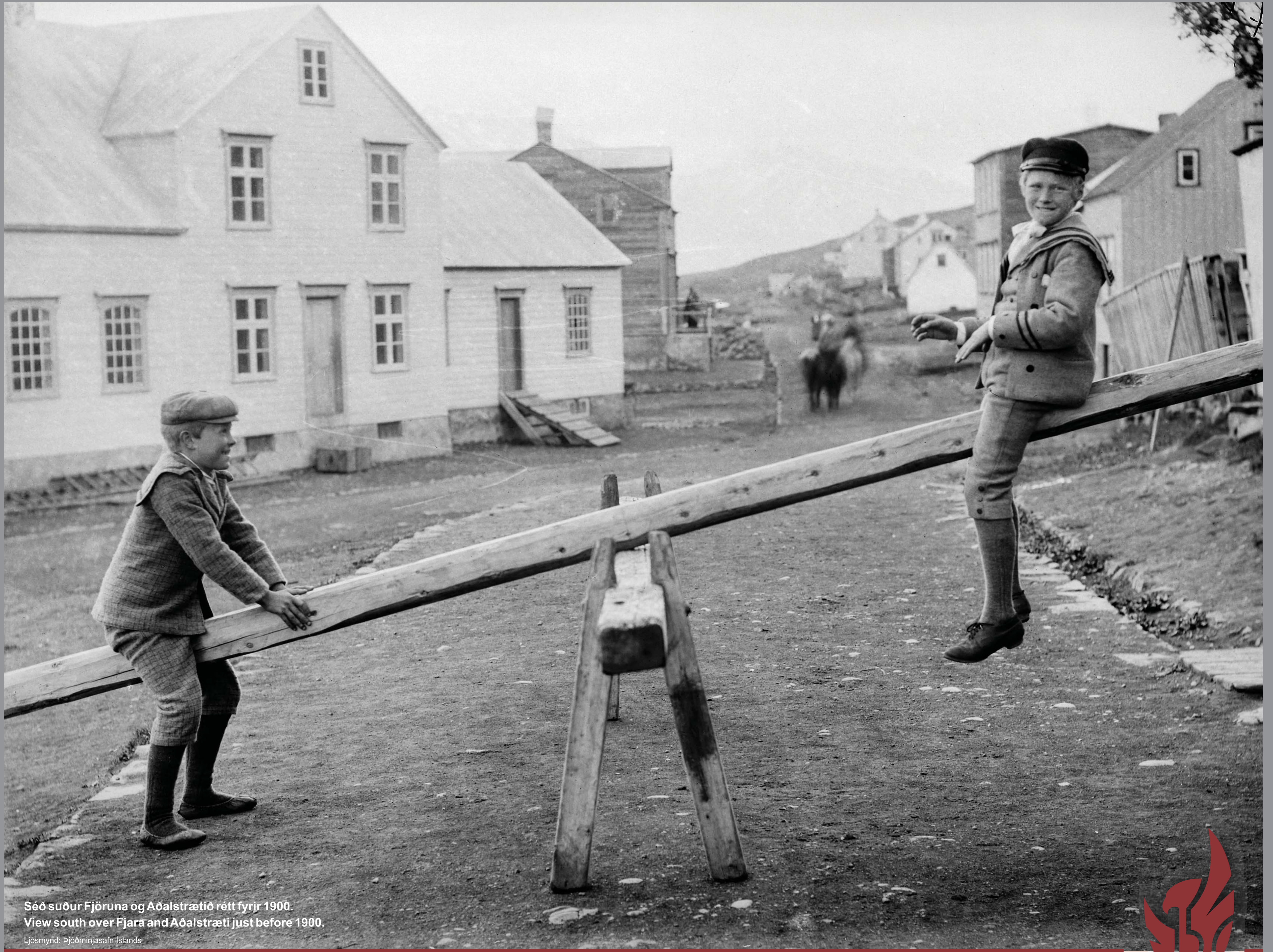
Séð suður Fjöruna og Aðalstrætið rétt fyrir 1900. View south over Fjara and Aðalstræti just before 1900.