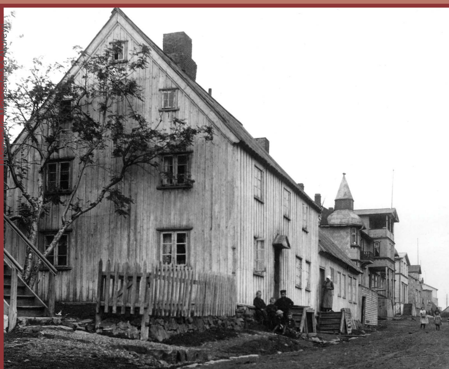
Séð norður Aðalstrætið um 1920. Næstur er Gamli spítali. Norðan hans sér í Hótel Akureyri er brann 1955. View north along Aðalstræti around 1920. Closest is the old hospital, to the north of which is Hótel Akureyri which fell victim to fire in 1955.