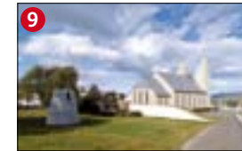
9 Akureyrarkirkja og safnaðarheimili a. 1940 og 1990. b. Guðjón Samúelsson, Húsamestari ríkisins, Safnaðarheimili: AVH ehf. c. Staðsetning kirkjunnar var umdeild á sínum tíma. Gluggi kirkjunnar er dómkirkjunnar í Coventry sem var jöfnuð við jarðu í síðari Heimstyrjöldinni af Þjóðverjum.