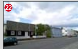
22 Hafnarstræti 11, Laxdalshús a. 1792. b. Byggt fyrir G.A. Kýhn. c. Elsta hús á Akureyri. Lengst af notað sem verslunarhús. Búið var í húsinu allt til ársins 1978. Eina húsið sem eftir stendur í röð líkra húsa sem brunn 1901. Nú standa við hlið hússins þrjú hús í fúnkisstíl.