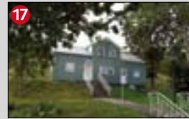
17 Aðalstræti 46, Friðbjarnarhús. a. 1851. b. Friðbjörn Steinsson bókbindari bjó í húsinu. Hann var stórtækur í sveitarstjórnarmálum og sat í flestum nefndum og ráðum bæjarins í um 15 ár. c. Góðtemplararegla Íslands var stofnuð í þessu húsi á árum Friðbjarnar.