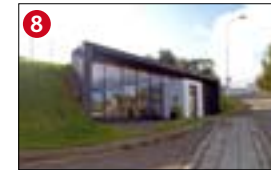
8 Kaupvangsstræti 29, Kartöflugeymslan a. 1937, endurgerð 2005. b. Hönnun endurbóta: Kollgáta ehf. c. Kartöflugeymslunni var bjargað frá niðurrifi á síðustu stundu af verktakanum sem átti að rífa hana. Fékk verðlaun Menningarmálanefndar Akureyrar árið 2005.