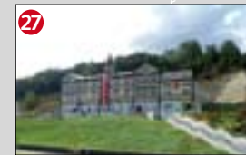
27 Hafnarstræti 57, Samkomuhúsið a. 1907. c. Þarna hafa frá upphafi verið haldnar leiksýningar og aðrar samkomur. Um tíma voru bæjarstjórnarfundir einnig haldnir í húsinu.