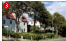
3 Oddeyrargata 26-36 a. 1926-34. c. Húsaröðin er ágætt dæmi um íslenska steinstyppuklassík á fyrri hluta 20. aldar.