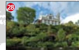
28 Eyrarlandsvegur 3, Sigurhæðir – Hús skáldsins Matthíasar Jochumssonar. a. 1903. b. Matthías lét byggja húsið 1903 og bjó þar til dauðadags 1920.