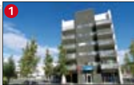
1 Strandgata 3 a. 1998. b. Úti og inni ehf. c. Bygging hússins mætti töluverðri andstöðu meðal ýmissa bæjarbúa en hlaut verðlaun Menningarmálanefndar Akureyrarbæjar.