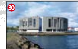
30 Menningarhúsið Hof a. Vinningstillaga Arkþings og Arkitema í samkeppni sem haldin var árið 2004. c. Húsið verður tekið í notkun árið 2010.