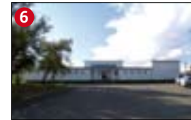
6 Íþróttahúsið Laugargötu a. 1941. b. Guðjón Samúelsson. c. Fyrirhugað var að byggja stóran íþróttasal vestan við núverandi byggingu en aldrei varð úr því.