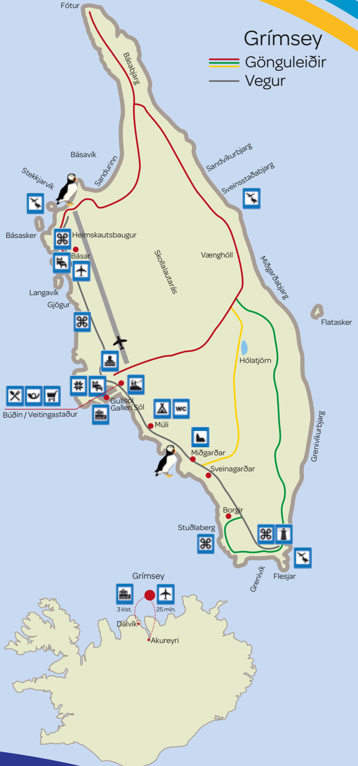
Útg. júní 2011. Ábyrgð: Akureyrarstofa. Hömum: STÍLL, Prentun: Ásprent.

Tjaldstæði Tjaldstæði er sunnan við félagsheimilið Múla. Þar er salernishús með heitu og köldu vatni. Afgreiðsla og upplýsingar varðandi tjaldsvæðið er í Búðinni.