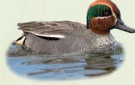
Urtönd (kk) ( Anas crecca ) Lengd: 34-38 cm