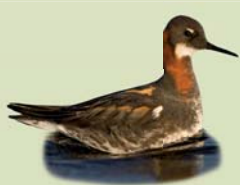
Óðinshani ( Phalaropus lobatus ) Lengd: 18-19 cm