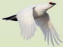
Rjúpa ( Lagopus muta ) Lengd: 34-36 cm