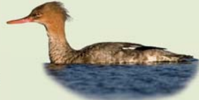
Toppönd (kvk) ( Mergus serrator ) Lengd: 48-53 cm