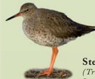
Stelkur ( Tringa totanus ) Lengd: 27-29 cm