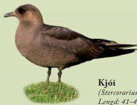
Kjó ( Stercorarius parasiticus ) Lengd: 41-46 cm