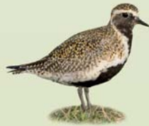
Heiðlóa ( Pluvialis apricaria ) Lengd: 26-29 cm