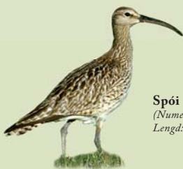
Spói ( Numenius phaeopus ) Lengd: 40-42 cm