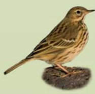
Þúfuttlingur ( Anthus pratensis ) Lengd: 14-15 cm