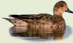
Rauðhöfðaönd (kvk) ( Anas penelope ) Lengd: 45-51 cm