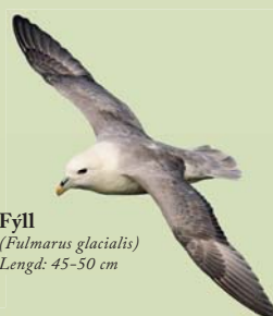
Fýll ( Fulmarus glacialis ) Lengd: 45-50 cm