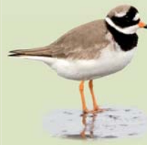
Sandlóa ( Charadrius hiaticula ) Lengd: 18-20 cm