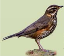
Skógarpröstur ( Turdus iliacus ) Lengd: 21 cm