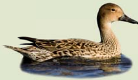
Grafönd (kvk) ( Anas acuta ) Lengd: 51-66 cm