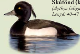
Skúfönd (kk) ( Aythya fuligula ) Lengd: 40-47 cm