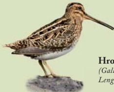
Hrossagaukur ( Gallinago gallinago ) Lengd: 25-27 cm