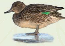
Urtönd (kvk) ( Anas crecca ) Lengd: 34-38 cm