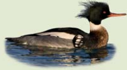
Toppönd (kk) ( Mergus serrator ) Lengd: 48-53 cm