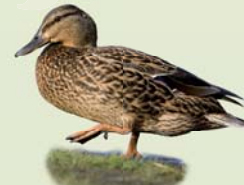
Stökkönd (kvk) ( Anas platyrhynchos ) Lengd: 50-65 cm