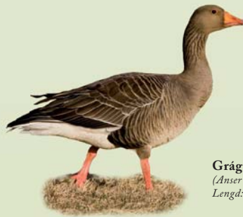
Grágæs ( Anser anser ) Lengd: 75-90 cm