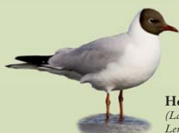
Hettumáfur ( Larus ridibundus ) Lengd: 34-37 cm