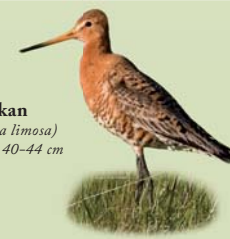
Jaðrakan ( Limosa limosa ) Lengd: 40-44 cm