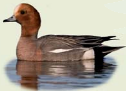
Rauðhöfðaönd (kk) ( Anas penelope ) Lengd: 45-51 cm