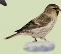
Auðnutittlingur ( Carduelis flammea ) Lengd: 12-14 cm