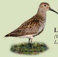
Lóupræll ( Calidris alpina ) Lengd: 16-20 cm