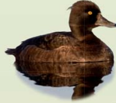
Skúfönd (kvk) ( Aythya fuligula ) Lengd: 40-47 cm