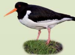
Tjaldur ( Haematopus ostralegus ) Lengd: 40-45 cm