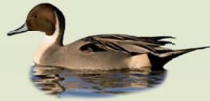
Grafönd (kk) ( Anas acuta ) Lengd: 51-66 cm