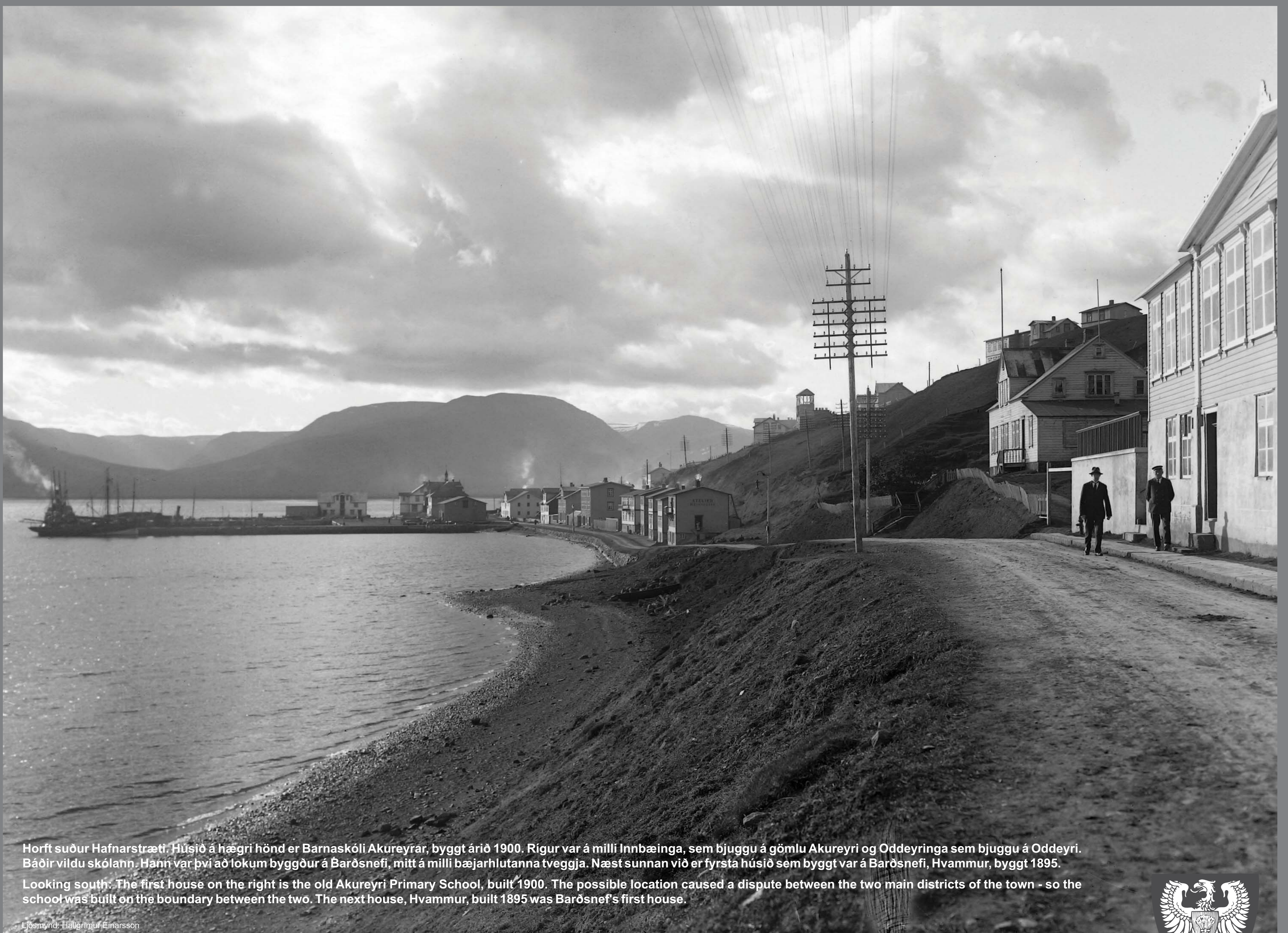
Horft suður Hafnarstræti. Húsið á hægri hönd er Barnaskóli Akureyrar, byggt árið 1900. Rígur var á milli Innbæinga, sem bjuggu á gömlu Akureyri og Oddeyringa sem bjuggu á Oddeyri. Báðir vildu skólann. Hann var því að lokum byggður á Barðsnefi, mitt á milli bæjarhlutanna tveggja. Næst sunnan við er fyrsta húsið sem byggt var á Barðsnefi, Hvammur, byggt 1895. Looking south. The first house on the right is the old Akureyri Primary School, built 1900. The possible location caused a dispute between the two main districts of the town - so the school was built on the boundary between the two. The next house, Hvammur, built 1895 was Barðsnef's first house.