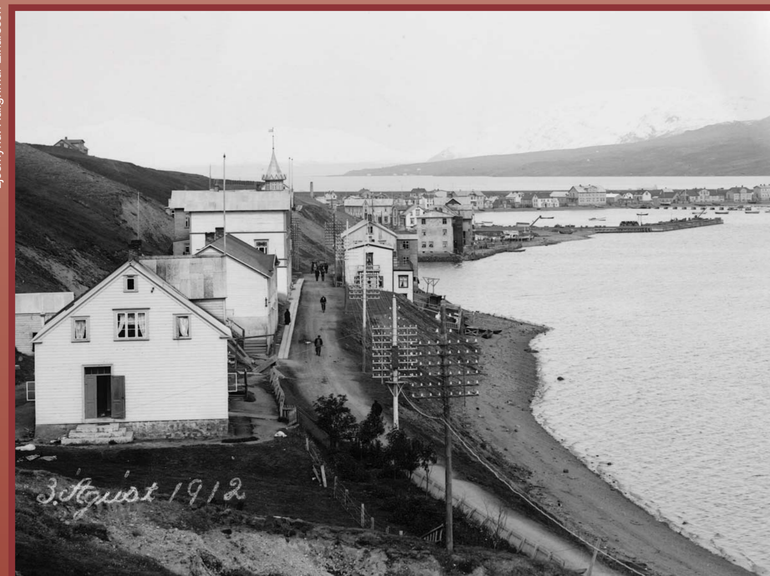
Horft til norðurs yfir húsaröðina á Barðsnefi árið 1912. Fremst er Hvammur, þá Barnaskólahúsið og síðan Samkomuhúsið (Gúttó). Norðan við Samkomuhúsið er gamall stígur upp brekkuna sem heitir Menntavegur ef hann er genginn upp en Glötunarstígur þegar farið er niður.

On 27 June 1903, in Barðsnef, a movie was shown for the first time in Akureyri, in a building which no longer exists.