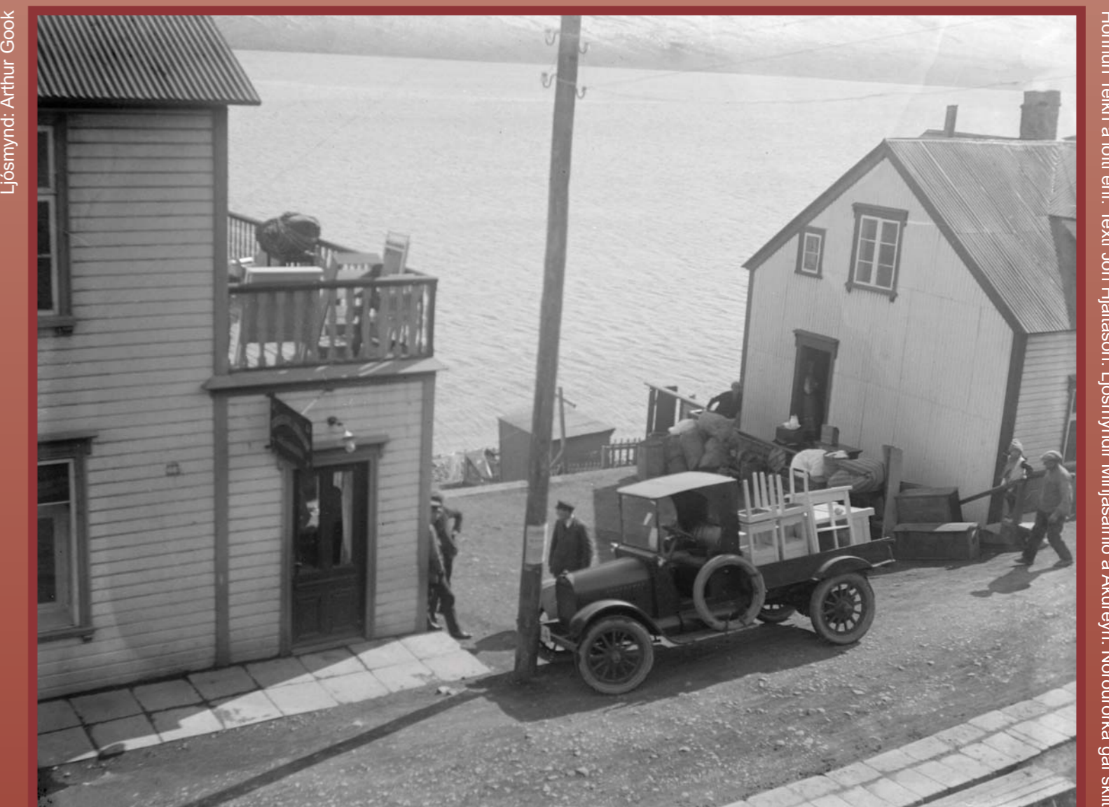
Kona stendur í dyrum Bogahúss. Er hún að flytja út eða inn? Bílstjórinn treystir ekki bremsunum og leggur vörubílnum að staurnum. Karlar halla sér að gamla leikhúsinu sem í janúarlök 1952 brann til kaldra kola. Bogahúsið var rífið 1980.