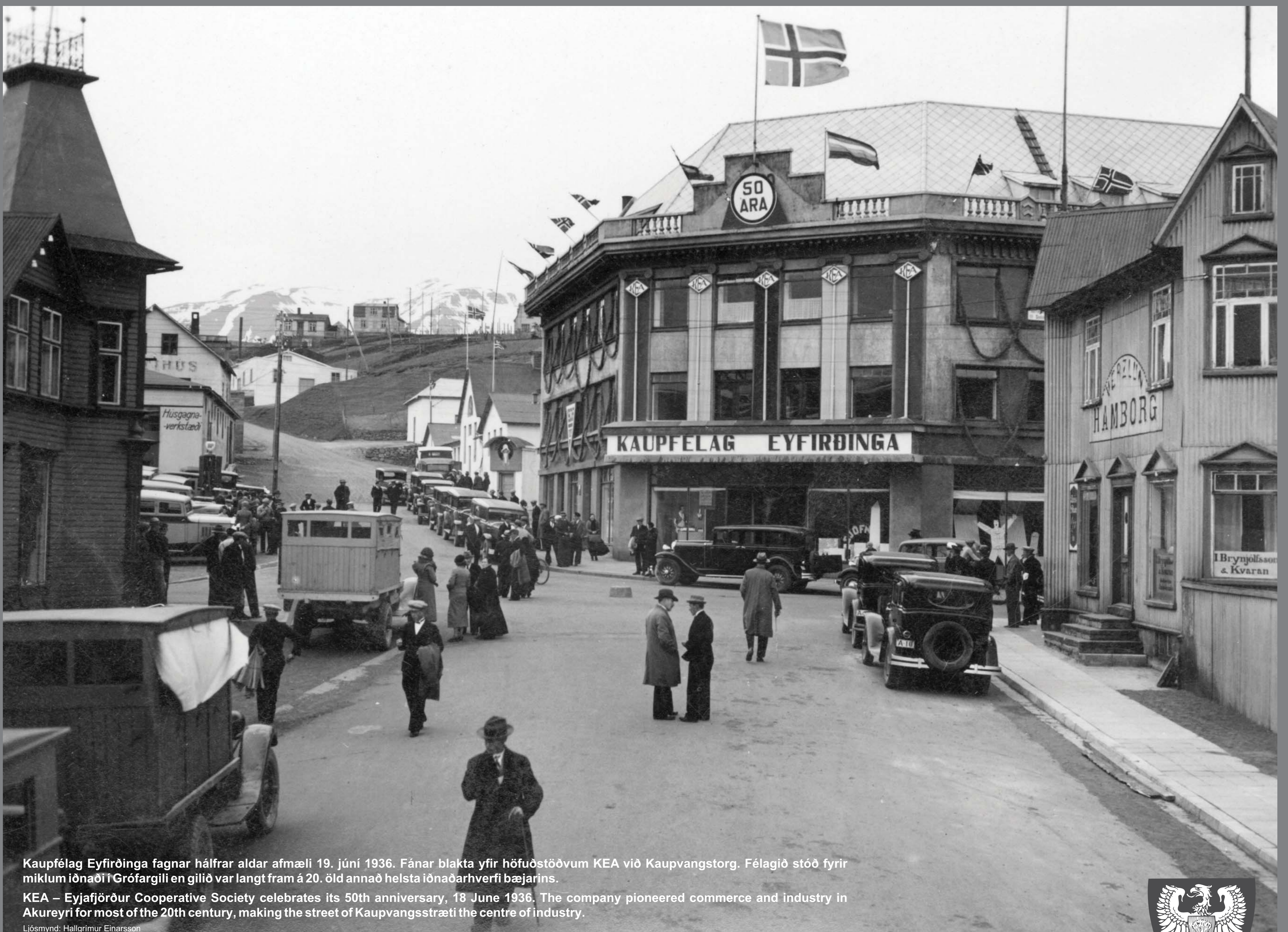
Kaupfélag Eyfirðinga fagnar hálfri aldar afmæli 19. júní 1936. Fána blakta yfir höfuðstöðvum KEA við Kaupvangstorg. Félagið stóð fyrir miklum iðnaði í Grófargili en gilið var langt fram á 20. öld annað helsta iðnaðarhverfi bæjarins.

KEA – Eyjafjörður Cooperative Society celebrates its 50th anniversary, 18 June 1936. The company pioneered commerce and industry in Akureyri for most of the 20th century, making the street of Kaupvangsstræti the centre of industry.