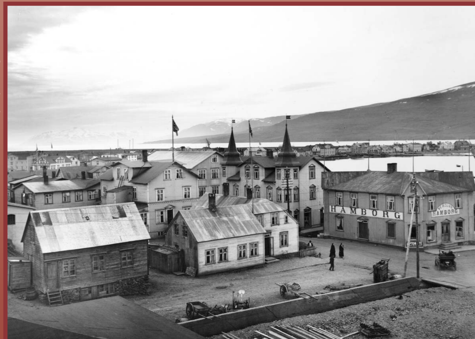
Kaupvangstorg 1925. Grófargilslækur rann niður gilið. Billheld brú er yfir lækinn. Andspænis Hamburg er fyrsta íbúðarhúsið í miðbænum, byggt 1894. Það var rífið til að rýma fyrir stórhýsi KEA sem reis 1930. Við hlið Hamburgar, sem byggð var 1909, er Paris, turnum prýtt, byggð 1913.

The regular Iceland steamer, Dronning Alexandrine, at Torfunefsbyggja Pier just before 1930. In the background, a pleasure cruiser; foreground, an early town hotel.