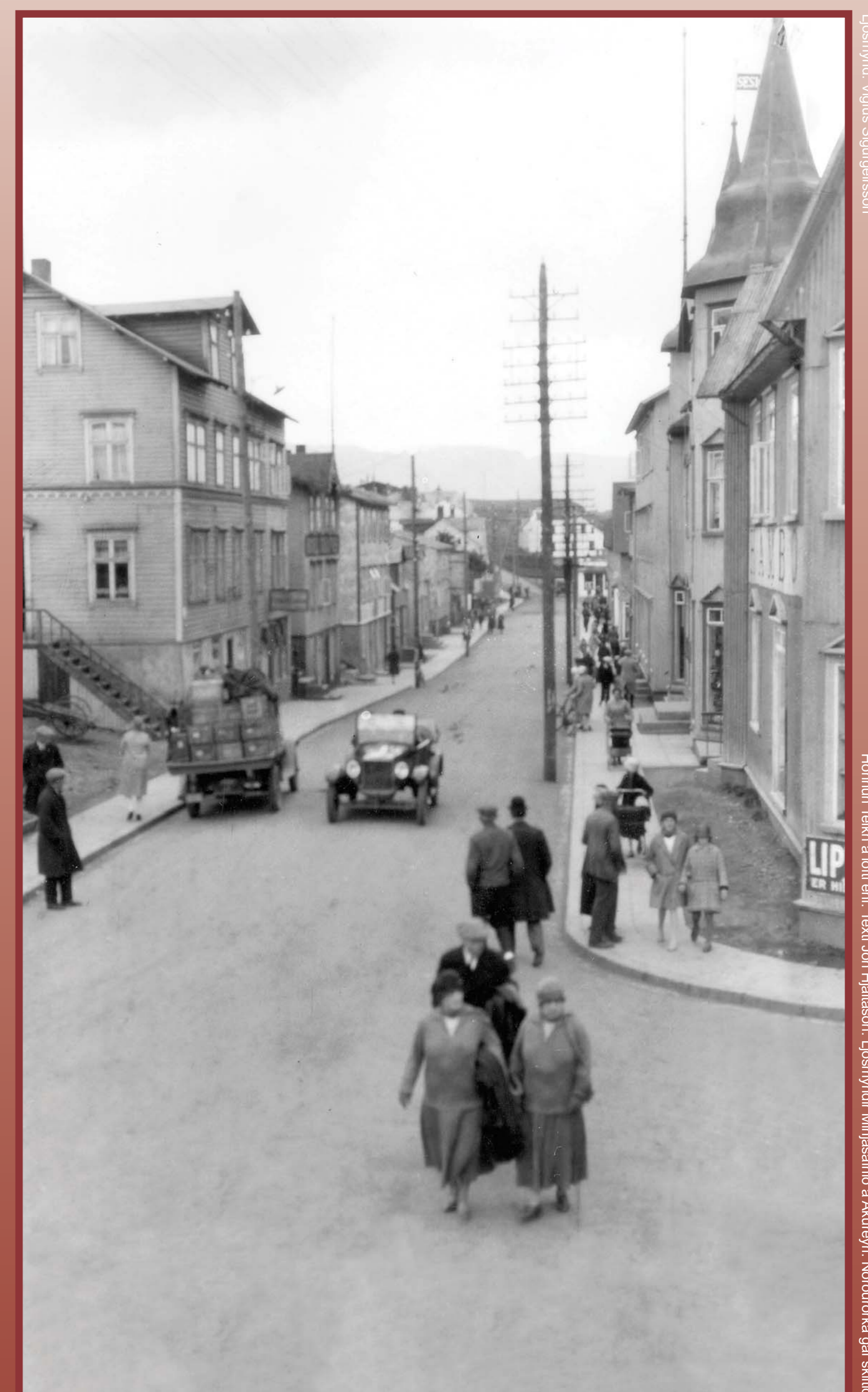
Miðbærinn árið 1927. Fremst til vinstri er Jerúsalem sem hýsti kvennaskóla og þar fyrir norðan er Hótel Goðafoss, á þessum lóðum byggði KEA seinna stórhýsi sín. Flest húsin vinstra megin götunnar eru nú horfin en mörg húsin hægra megin standa enn.

Kaupvangstorg in 1925. A bridged stream flows down the slope. Opposite Hamburg, one of Akureyri's major stores, is the first residential building in the town centre, built in 1894 and demolished in 1930 to create space for the new KEA headquarters. The building boasting two towers is another important store, named Paris.