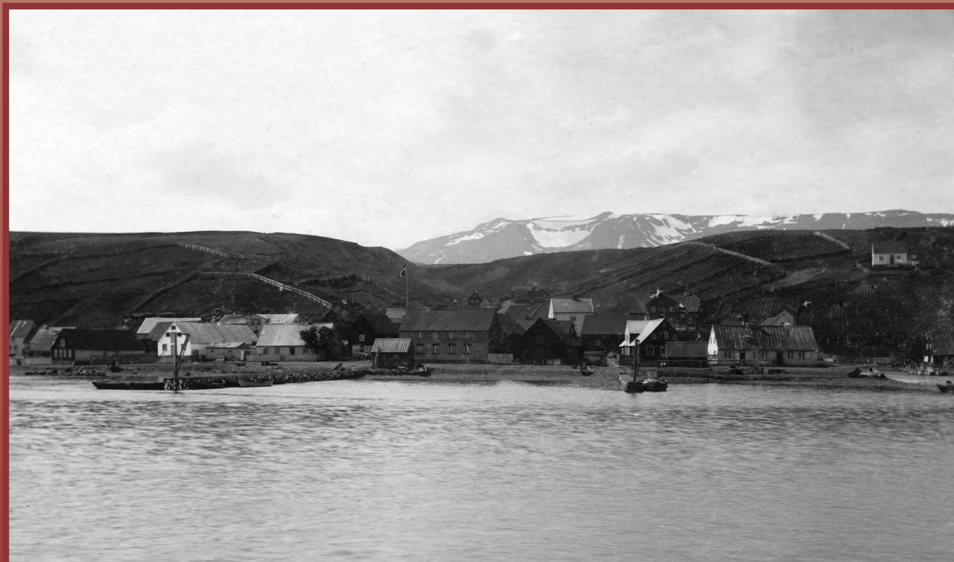
Horft yfir gömlu Akureyri um 1890. Laxdalshús þekktist af reynitrénu sem stendur fyrir framan það. Öll húsin næst Laxdalshúsi eru brunnin eða hafa verið rífin. A view of old Akureyri around 1890. Laxdalshús can be identified by the rowan tree in front of it. All the buildings in the vicinity of Laxdalshús have either burned down or been demolished.