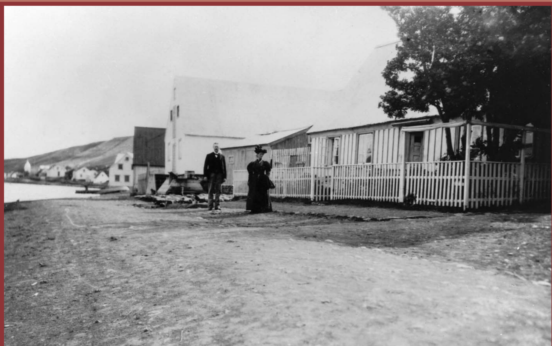
Séð suður götuna frá Laxdalshúsi 1896. Árið 1836 voru tvö tré á Akureyri, annað þeirra reyniviður í garðinum við Laxdalshús, líklega gróðursettur um 1820. Looking south from Laxdalshús in 1896. There were only two trees in Akureyri in 1836, one a rowan which stood in the garden of Laxdalshús and was planted around 1820.

Although primarily used as residential and commercial premises, the house also became, in 1827, the first headquarters of the newly established district archives and town library. Here books could be borrowed free of charge and the librarian – a Danish merchant – received no salary. In 1943 Akureyri municipality purchased the house for the express purpose of housing homeless people. This purchase, however, apparently achieved little as the house already accommodated 22 individuals. Laxdalshús became a protected building in 1978 and was reopened after extensive renovation in June 1984. Since then, various activities have been conducted under its roof.