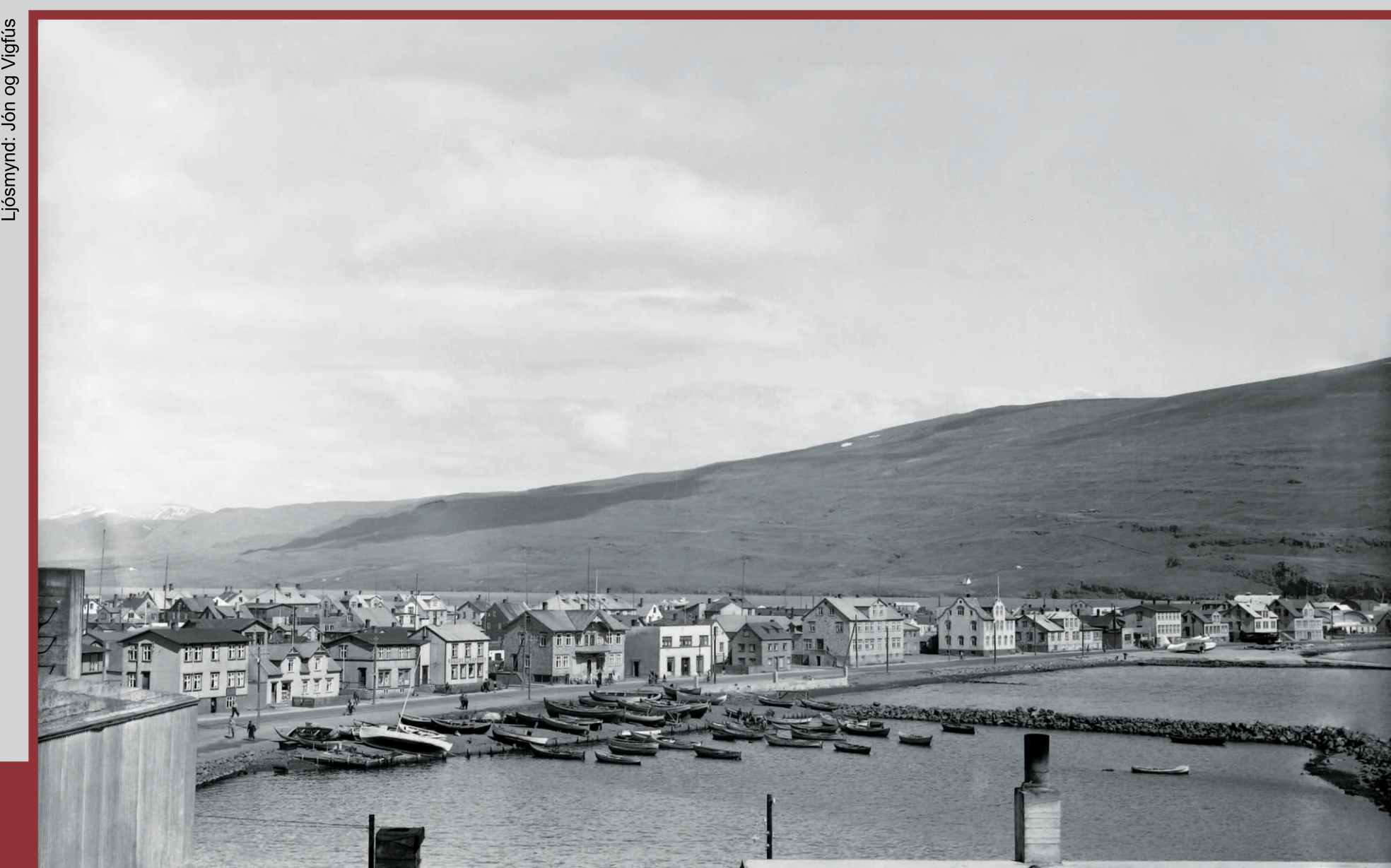
Oddeyrir um 1950. Ásýnd Strandgötunnar hefur breyst mikið í gegnum árin. Upphæflega lá gatan fast upp við húsín í fjörukambinum en smám saman var fyllt upp í Pollinn, bætt var við þvotta- og flugplani, einnig smábátahöfn, og gatan að lokum færð utar. Nú stendur Menningarhúsið Hof þar sem smábátahöfnin var áður (vígt 2010).

Oddeyri is Akureyri's second oldest district. The site was only used for parliamentary meetings from early 14th century until 1551 when two warships arrived to quell a rising led by the Roman Catholic bishop, Jón Arason, of Hólar, who had, however, been executed the year before. No battle ensued, but his possessions were confiscated and given to the king and his heirs. In 1874 the 1000 year anniversary of the settlement of Iceland was celebrated on Oddeyri. Nothing was built there due to lack of drinking water and flooding risks from Glerá River. However, in 1866, the Danish authorities agreed to include Oddeyri in the township of Akureyri. The first house, Lundur, was built in 1858. A similar house of the same name stands at Eiðsvallagata 14. After 1870 building began in earnest with the establishment of Gránufélag, Akureyri's first commercial company. Around 1900 Akureyri had 10 streets, 5 of which were on Oddeyri; Strandgata, Glerárgata, Lundargata, Norðurgata and Grundargata.