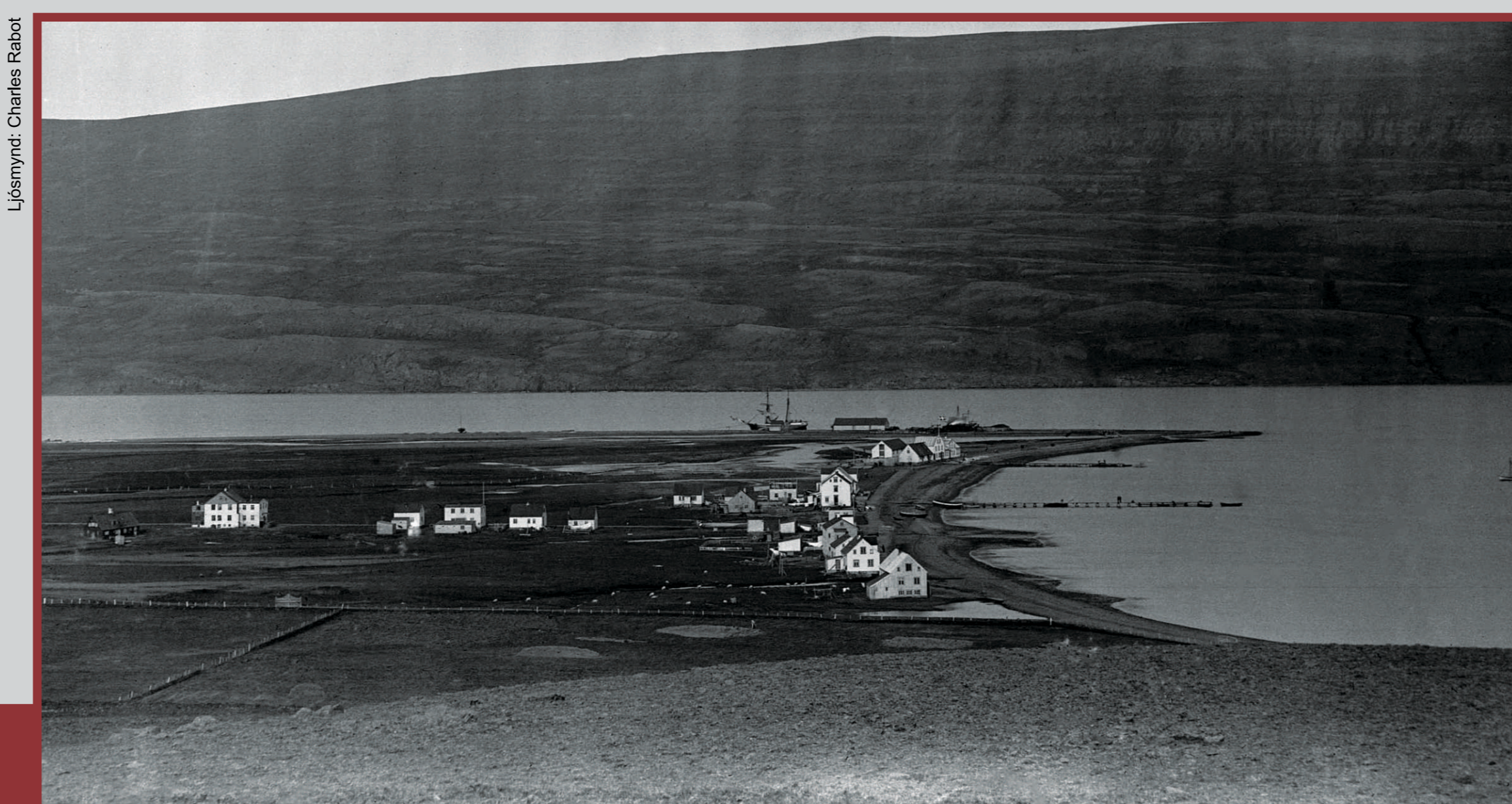
Oddeyrir um 1890 þar sem glöggst má sjá ummerki um farveg Glerár um eyrina. Á þessum tíma var Strandgatan aðalgatan og neðst við hana, við síkið, stóðu hús Gránufélagsins. Lengst til vinstri standa elstu hús eyrarinnar, Gamli Lundur og Stóra steinhúsið við Norðurgötu.

Oddeyrir 1931. The built-up area has expanded north from Strandgata. Gránufélagsgata forms a straight line the entire length of Oddeyri. The river flats by the Gránufélag buildings have shrunk.