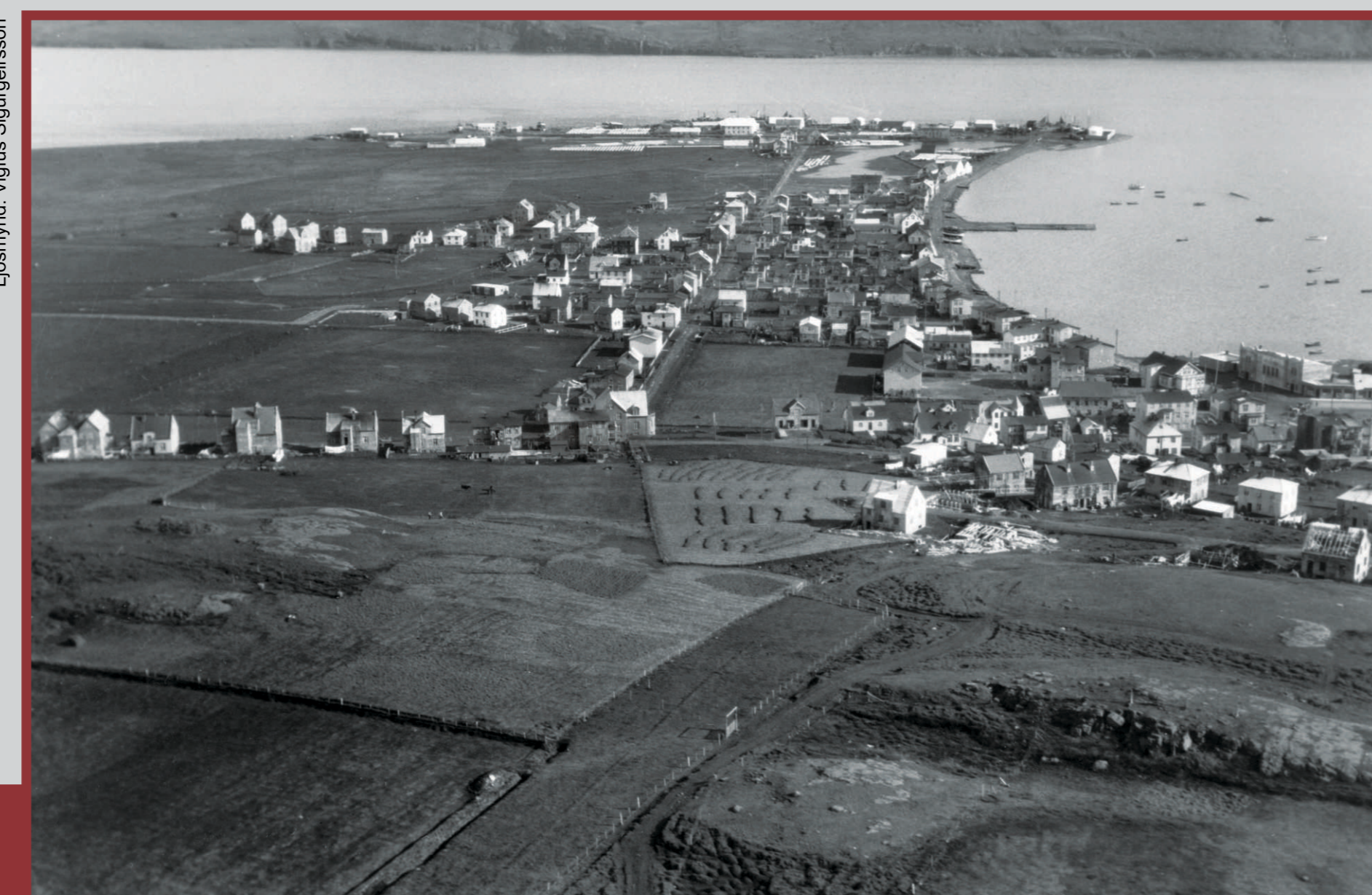
Oddeyrir 1931. Byggðin er tekin að teygja sig í norður út frá Strandgötu. Gránufélagsgata liggur eins og beint strík niður endilanga eyrina. Ósinn við Gránufélagshúsin hefur minnkað.

Oddeyrir around 1950. Strandgata has changed greatly over time. Originally it was close to the shoreline but landfills pushed the shore back to create an air strip, a car wash facility and a small boat harbour where Hof Cultural Center now stands (inaugurated 2010).