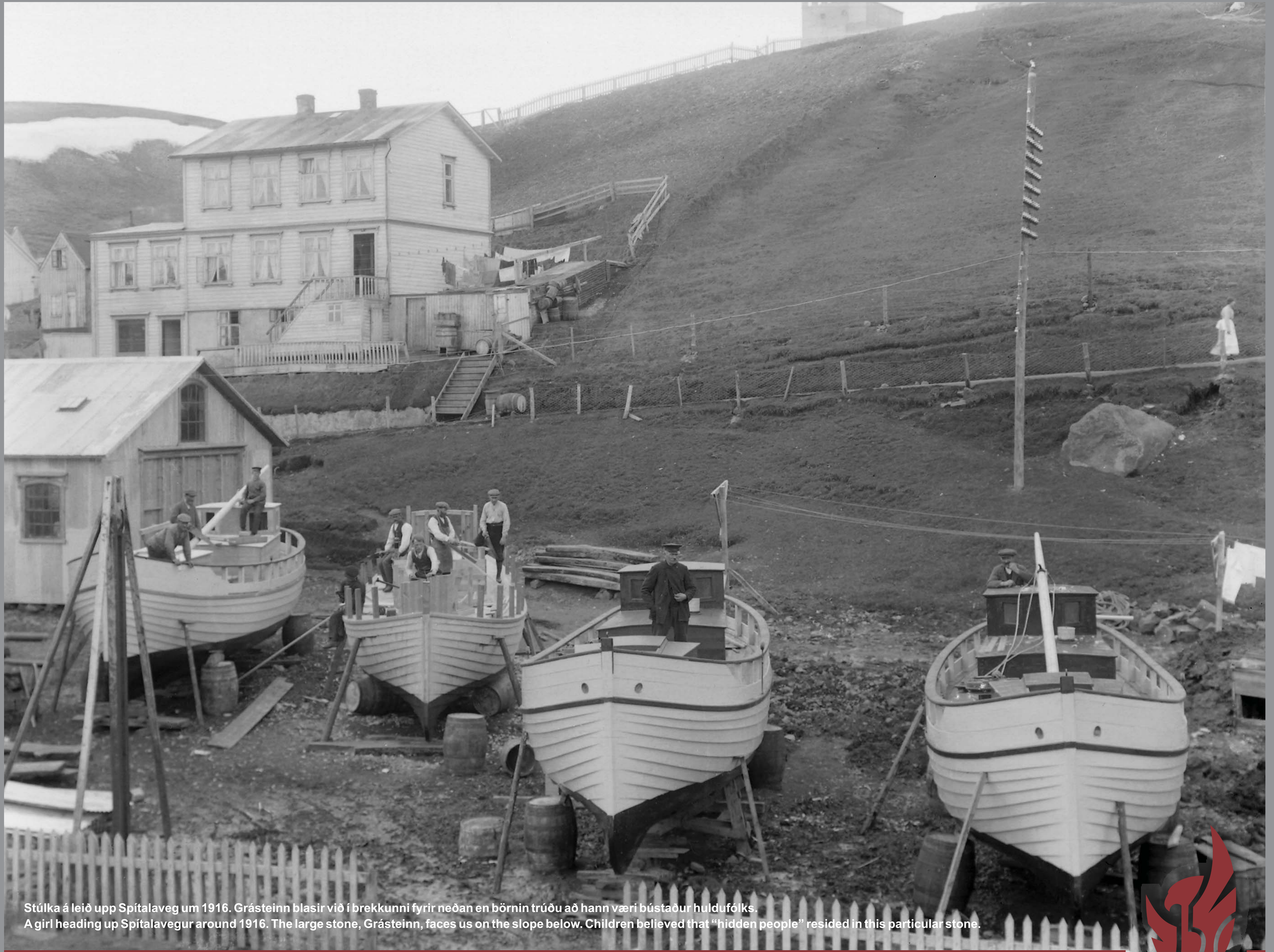
Stúlka á leið upp Spítalavegur um 1916. Grásteinn blasir við í brekkunni fyrir neðan en börnin trúðu að hann væri bústaður huldufólks. A girl heading up Spítalavegur around 1916. The large stone, Grásteinn, faces us on the slope below. Children believed that "hidden people" resided in this particular stone.