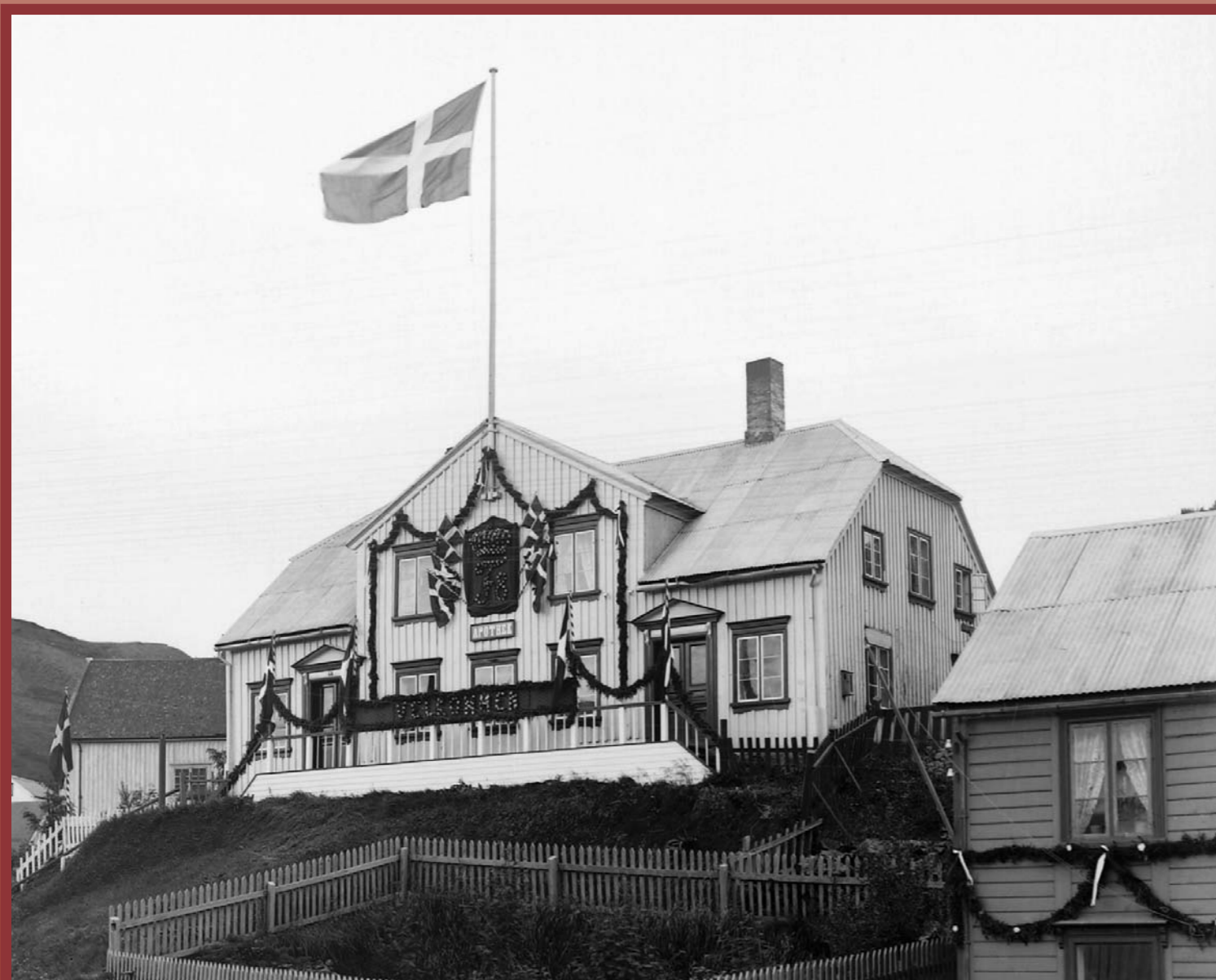
Gamla apótekið við Aðalstræti 4 skreytt í tilefni konungskomunnar 1907. Þegar það var byggt 1859 var það mun stærra og skrautlegra en öll önnur hús á Akureyri. The old apothecary (pharmacy) at 4 Aðalstræti was decorated on the occasion of the royal visit in 1907. When it was built in 1859 it was the largest and most decorative house in Akureyri.

Here the boundaries of the old town are within easy reach. Heading up the path, you will soon spot Grásteinn (Greystone) on your right. When it was decided in 1787 that Grásteinn should serve as a landmark for the northern boundary of Akureyri, this rock was considerably larger than the humble boulder in front of you. The original Grásteinn was blown to pieces when a road was built in 1897, and you are looking at its mere remains. To the left, is an impressive building, Spítalavegur 1 (1 Hospital Road), home to Akureyri's first shoe shop, opened 1890. This road, which is now a pleasant footpath, once ran all the way up the hill to where the municipal hospital was erected in 1899; hence its name. Now take a close look at the strangely conjoined building, Aðalstræti 2A and 2B; a large building indeed as it is, in fact, two houses combined. Originally it closely resembled Nonnahús Museum, built around 1850. Since then, the house has been extended in every direction so that, without doubt, few houses in Akureyri have undergone such dramatic transformation. Akureyri primary school was housed here during the winter 1872-73 and for some time the building boasted the town clock by which all the townspeople would adjust their pocket watches.