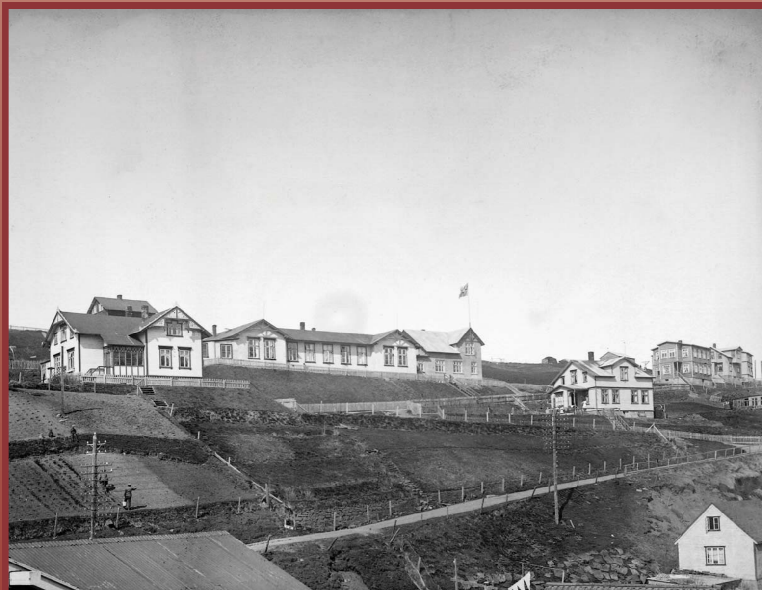
Langa húsið fyrir miðri mynd er spítalinn sem var í notkun 1899 - 1953. Húsið var síðan flutt upp í Hlíðarfjall og er stofninn að núverandi skíðahótel. The long building in the centre is the hospital which was in use from 1899 - 1953. The house was later transported up to the slopes of Mt. Hlíðarfjall and became the forerunner of the present ski-hotel.